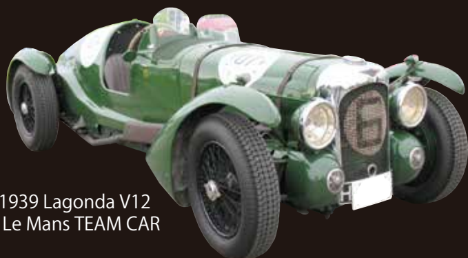
1939 Lagonda V12 Le Mans TEAM CAR