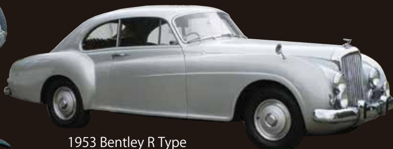
1953 Bentley R Type Continental Fastback by H.J.Mulliner (非売品)