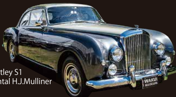
1956 Bentley S1 Continental H.J.Mulliner