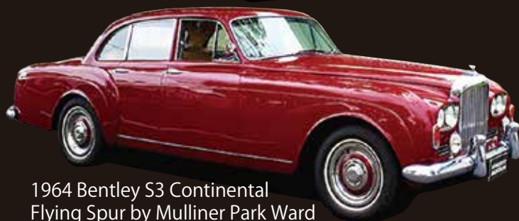
1964 Bentley S3 Continental Flying Spur by Mulliner Park Ward