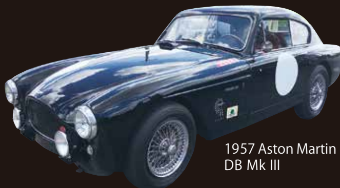
1957 Aston Martin DB Mk III