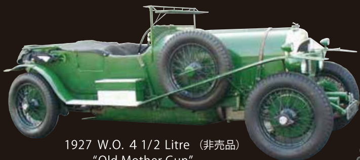
1927 W.O. 4 1/2 Litre (非売品) "Old Mother Gun"

ミュージアムではそれに合わせ、ベントレーのスポーツ・マインドにテーマを絞った名車継承販売会として、1920年代から1930年代(W.O.からタービーの時代)のベントレーを中心に集め、展示販売いたします。