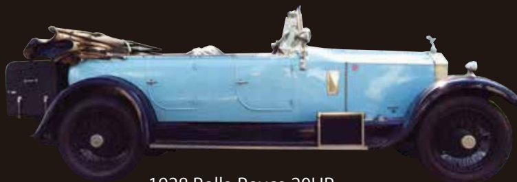
1928 Rolls-Royce 20HP Open-Tourer by Barker Style