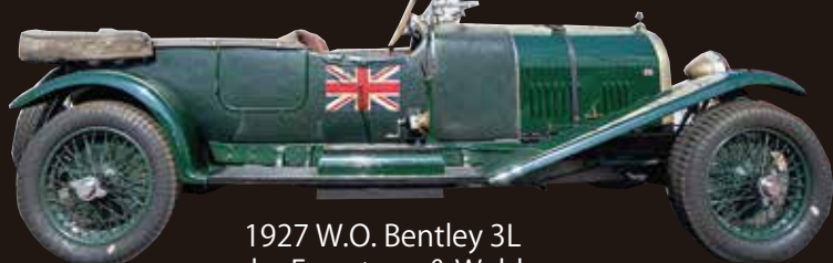
1927 W.O. Bentley 3L by Freestone & Webb