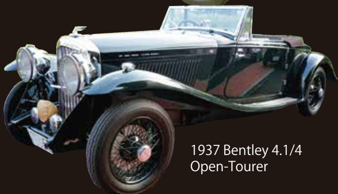
1937 Bentley 4.1/4 Open-Tourer