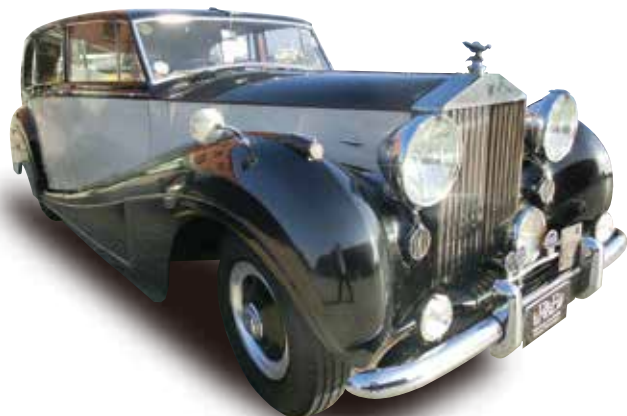
1951 ROLLS-ROYCE SILVER WRAITH 機関好調、内外装はオリジナルのまま