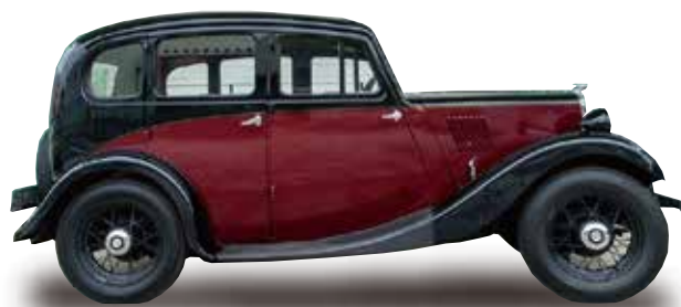
1935 Morris Eight 4 door Saloon 可愛いクラシックカー