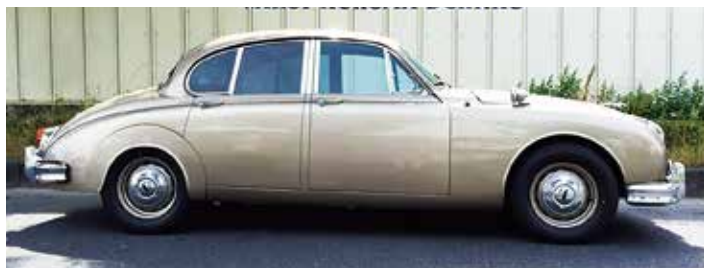
1964 JAGUAR Mk2 品3のシングルナンバー車