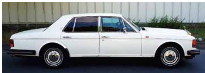
1990 Rolls-Royce Silver Spirit II 絶好の入門車