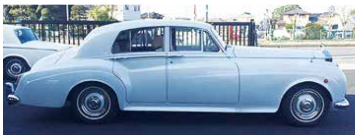
1958 Rolls-Royce Silver Cloud I Standard Steel Saloon) 千昌夫が所有した車