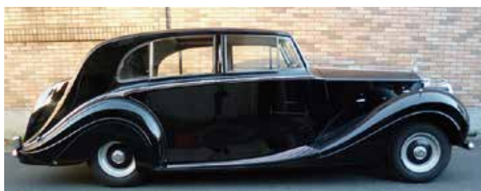
1954 Rolls-Royce Silver Wraith Limousine by Freestone & Webb 戦後に生産されたRRの頂点