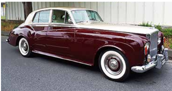
1964 Bentley S3 Standard Steel Saloon 最後のシャーシー別の車体